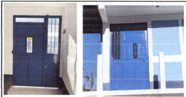
Foto 5: PUERTA DE METAL EN SUSTITUCION DE PUERTA DE MADERA EN COCINA

Observación: Si es necesario se pueden agregar hojas adicionales y actualizar el número de hojas.