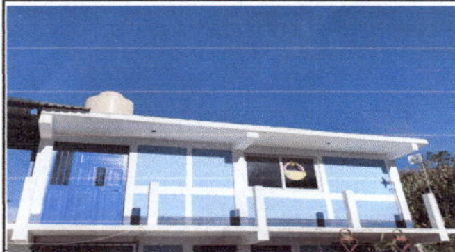
Foto1: SUSTITUCION DE PAREDES DE LAMINA POR PAREDES DE BLOCK EN COCINA